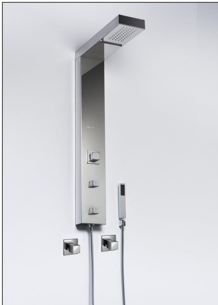
Coluna de Banho - TREND

Os produtos Unique SPA, contam com a mais alta qualidade e a sua instalação faz parte dela. Para garantir a sua segurança e de nosso cliente, antes de instalar este produto, leia atentamente esse manual.